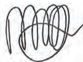
Dra. Phumzile Mlambo-Ngucka Secretaria General Adjunta de las Naciones Unidas y Directora Ejecutiva de ONU Mujeres