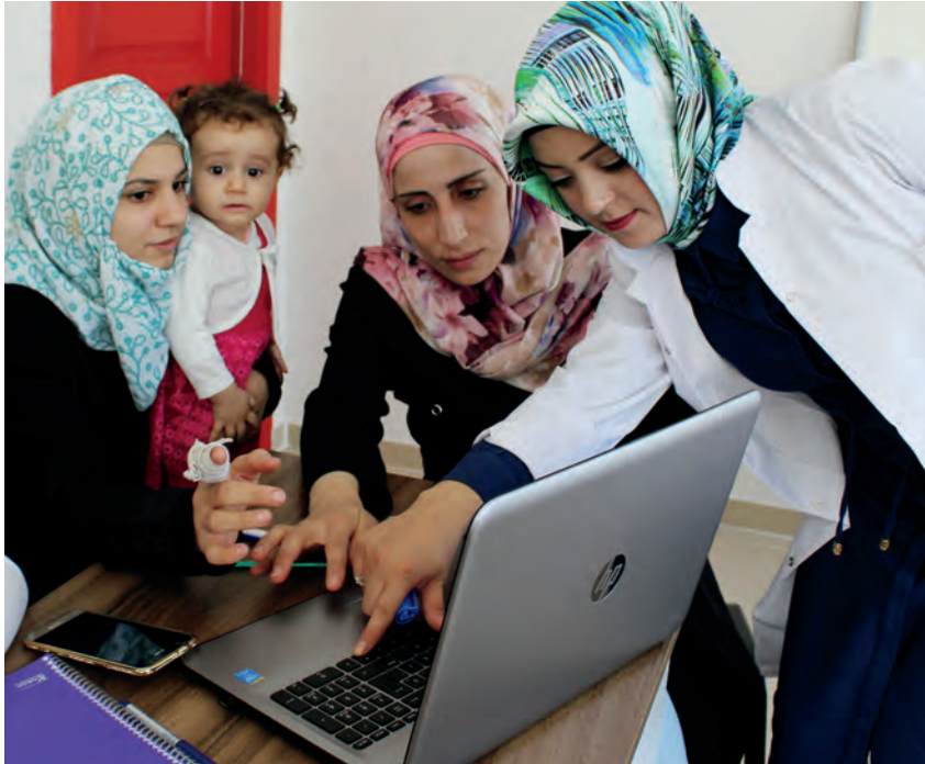
En el Centro SADA para Mujeres de Gaziantep, Turquía, las refugiadas sirias y mujeres de las comunidades locales asisten a cursos de computación. Estos son una oportunidad para aprender nuevas destrezas y estrechar relaciones.

Comisión, al formular su programa de trabajo, reconoció también que la paz y la justicia dependen de la igualdad de género. Con esta convicción recurrió a ONU Mujeres para que le ayudara a establecer un comité especial que aportara una dimensión de género a todas las actividades.