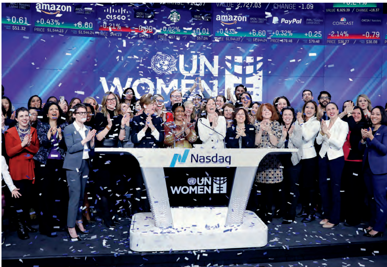
Para conmemorar el Día Internacional de la Mujer, las campanas de 63 mercados bursátiles del mundo sonaron para instar a las empresas a hacer su parte por la igualdad de género. La Directora Ejecutiva de ONU Mujeres Phumzile Mlambo-Ngcuka (centro, al frente) tañó la campana de cierre de jornada del Mercado de Valores Nasdaq, junto a la Presidenta y Gerente Ejecutiva de Nasdaq Adena Friedman (centro, a la derecha de la Directora Ejecutiva de ONU Mujeres).

En Nueva York, el tañido de la campana al cierre de la jornada del Mercado de Valores Nasdaq también marcó el intercambio de adhesiones a los Principios para el Empoderamiento de las Mujeres . Esta iniciativa de ONU Mujeres y el Pacto Mundial de las Naciones Unidas consiste en un conjunto de siete principios que brindan directrices prácticas a las empresas para promover la igualdad de género y el empoderamiento de