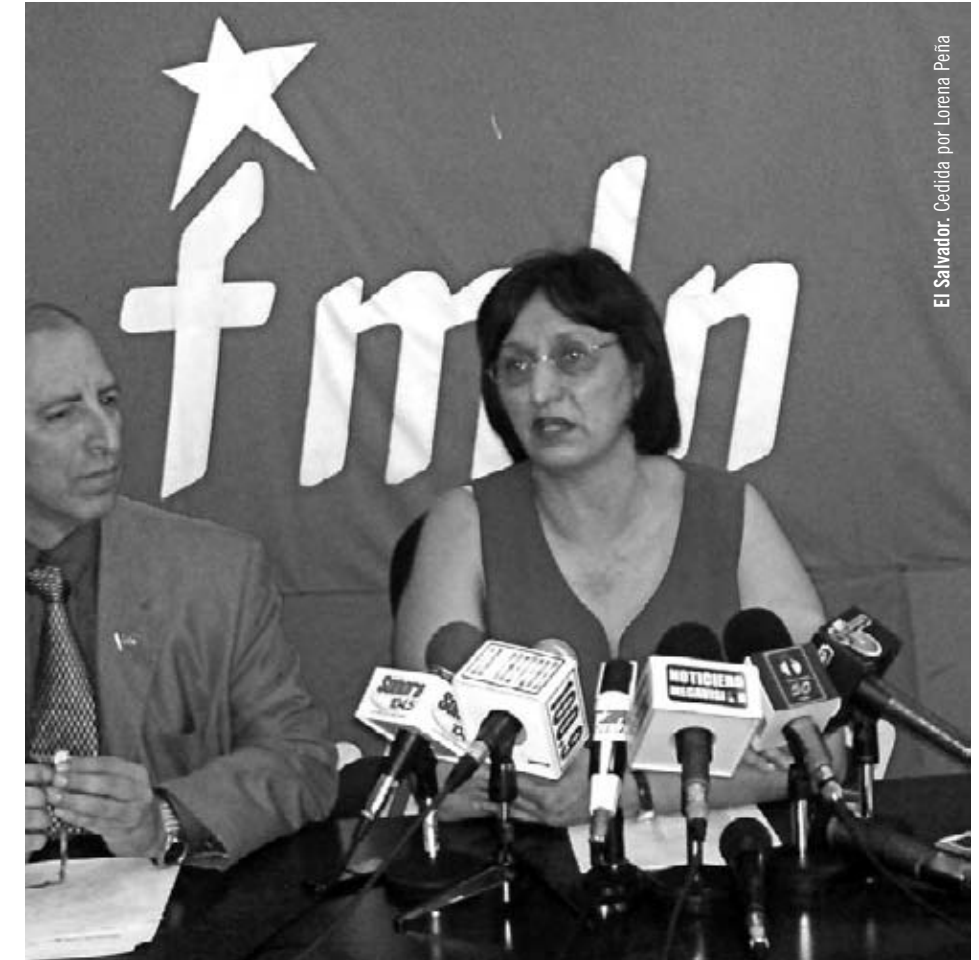
El Salvador.

La maternidad. La mayoría de mujeres que tuvimos hijos e hijas durante la guerra tuvimos que salir a parir y después dejarles con familiares, en refugios o en las comunidades cercanas para luego regresar de nuevo al frente de guerra. Este hecho para nosotras era un acto de conciencia, creo que la mayoría —hasta hoy— no renegamos de haberlo hecho y haber decidido en aquel momento volver a reincorporarnos a la guerrilla. Sin embargo, era generalizado que después de sufrir ese dolorosísimo proceso de separación de nuestros hijos e hijas, regresábamos a un medio donde a nadie le interesaba saber de estos dolores, donde habitualmente se nos relegaba a tareas inferiores a las que teníamos antes y, donde por lo general, encontrábamos al padre de la criatura nuevamente acompañado... y esa soledad profunda, y esa depresión terrible, si no era superada con rapidez, era tomada como muestra de una debilidad personal. Porque, al igual que en estos tiempos, el sistema celebra la maternidad y al mismo tiempo condena a las madres con mil hechos sutiles o brutales. Y qué formidable conciencia teníamos y tenemos las mujeres, que nos sobreponíamos a todo esto para seguir luchando por el ideal en que creíamos y creemos fir-