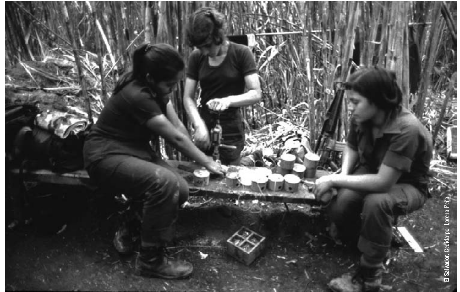
El Salvador. Cedita por Lorena Peña

Una guerra no es un camino de rosas. Una guerra es un recurso último y brutal al que no debemos aspirar como camino de progreso en todo momento. El ideal de democracia, de igualdad, de justicia, y de paz debe guiarnos siempre, y la mejor forma de no retornar al pasado es recordando correctamente lo vivido y luchando por superar definitivamente la violencia institucionalizada en la pobreza, en la exclu-