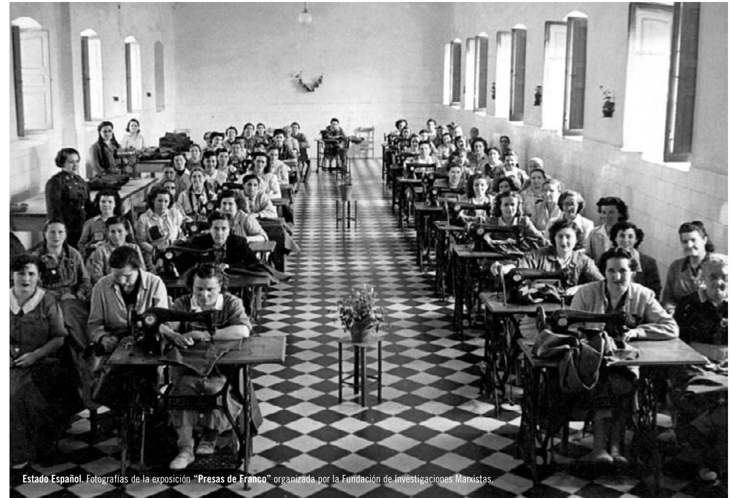
Estado Español. Fotografías de la exposición “Presas de Franco” organizada por la Fundación de Investigaciones Marxistas.

El primer gran debate cuando se trata la cuestión de la represión femenina durante la Guerra Civil española y la primera posguerra suele producirse al tratar de señalar el número exacto de mujeres encarceladas durante ese periodo. Nos encontramos, antes que nada, con un problema de falta de fuentes. El silencio que las autoridades franquistas mantuvieron respecto a las prisioneras impide, o al menos dificulta mucho, la tarea de cuantificar el fenómeno. No hay datos oficiales y los pocos que hay no parecen fiables. Parece ya descartada la cifra de 17.800 encarceladas que José Manuel Sabin propuso para 1940. Este número queda invalidado por el hecho de ser una mera extrapolación a partir del porcentaje de mujeres de la prisión de Toledo y basándose en datos