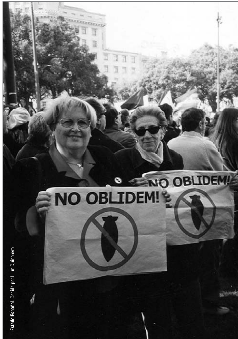
Estado Español. Ceditada por Llum Quiñonero