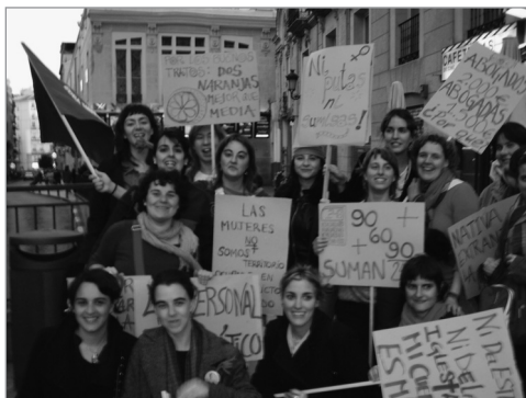
Manifestación 8 de marzo 2006.

Una tarde lluviosa, en las oficinas de una ONGD de Madrid, se encuentran tres periodistas en una reunión. Una trabaja en una revista política, otra en una agencia de noticias ecologista, la tercera en esa ONGD. Allí se reúne un grupo de mujeres que imagina formas de mejorar la vida de las mujeres de todo el mundo, que siente que la suya propia está unida a la de las demás. Entre todas piensan maneras de hacer visible la falta de derechos, la injusticia, la violencia sobre una mitad de la población del planeta, que ha nacido con sexo femenino. A la salida las tres perio-