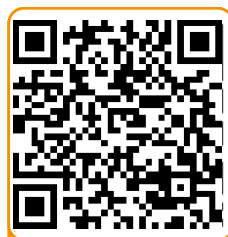
Snotes para imprimir