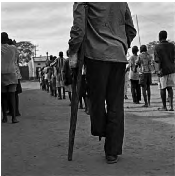
Ex niño soldado, mutilado como consecuencia de haber pisado una mina. Centro de rehabilitación World Vision, Gulu, norte de Uganda.

Al igual que ocurre con el reclutamiento para las fuerzas armadas, la educación merece especial atención, ya que las escuelas pueden formar parte del problema y, a la vez, de la solución . Al negárseles una educación adecuada, los menores que abandonan los estudios no están preparados para lograr un empleo en el mundo moderno y están más expuestos al reclutamiento por parte de grupos armados.