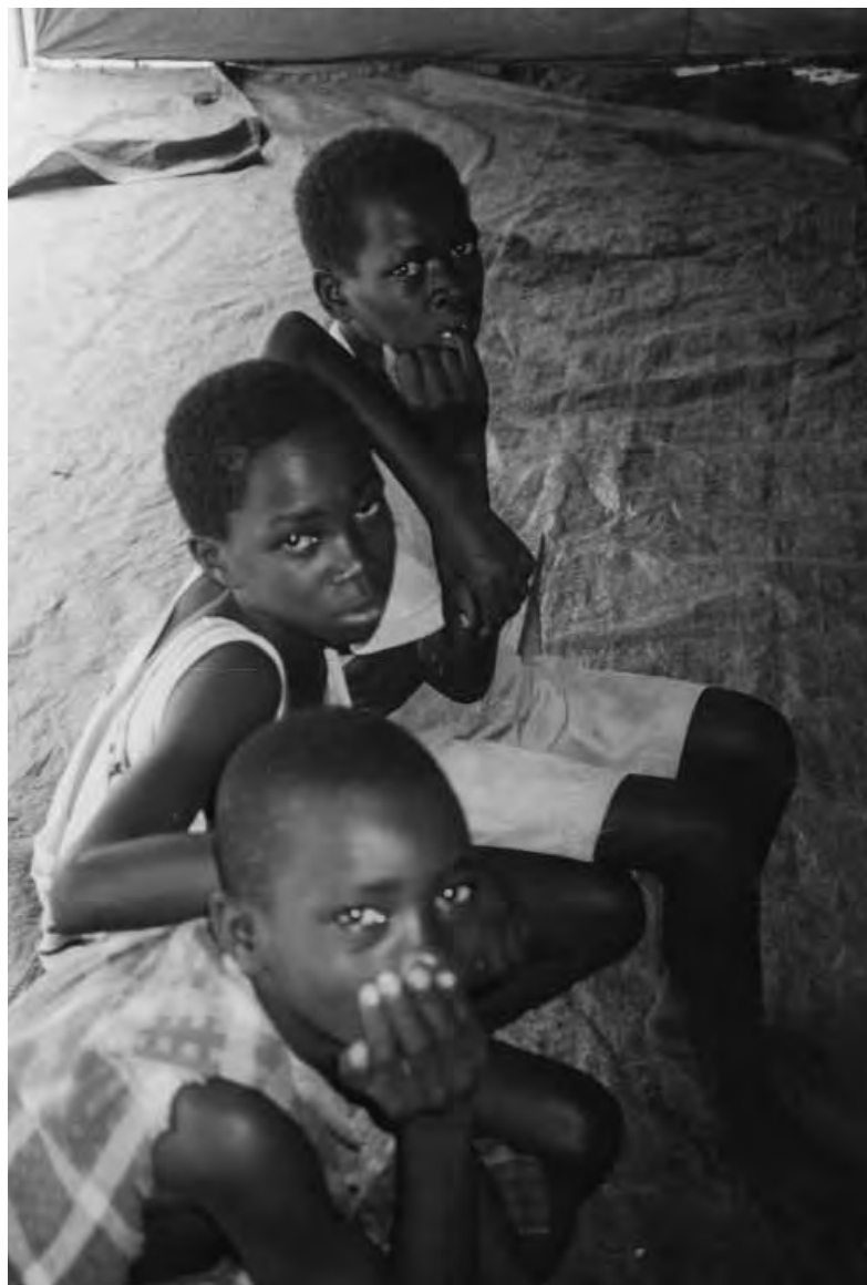
Ex menores soldados, Bujumbura.

Las medidas para prevenir el reclutamiento no sólo debe propiciarlas el conflicto. El Protocolo Facultativo exige que los Estados tomen todas las medidas posibles para evitar que los grupos armados recluten y utilicen a menores de 18 años. El primer paso consiste en tipificar como delito estas prácticas en la legislación nacional. Aparte de esto, la protección duradera se logra cambiando las condiciones que hacen posible, o casi inevitable, el reclutamiento, como ocurre con las situaciones en Chad, la República Centroafricana y Somalia. Gobiernos ineficaces, ausencia de protecciones jurídicas para los menores y de instituciones efectivas para hacerlas cumplir, pobreza, discriminación, exclusión social y política, falta de acceso a la educación y a la formación profesional y posibilidades limitadas de ganarse la vida son factores que crean las condiciones para el reclutamiento. También resulta más probable que los menores se vean arrastrados hacia grupos armados tras haber sufrido violaciones de derechos humanos u otras formas de violencia, incluida la doméstica. Los gobiernos y las sociedades que no dan prioridad a la promoción y protección de los derechos de los niños y niñas –tanto económicos, sociales y culturales como civiles y políticos– son también responsables de que los menores acaben engrosando las filas de los grupos armados.