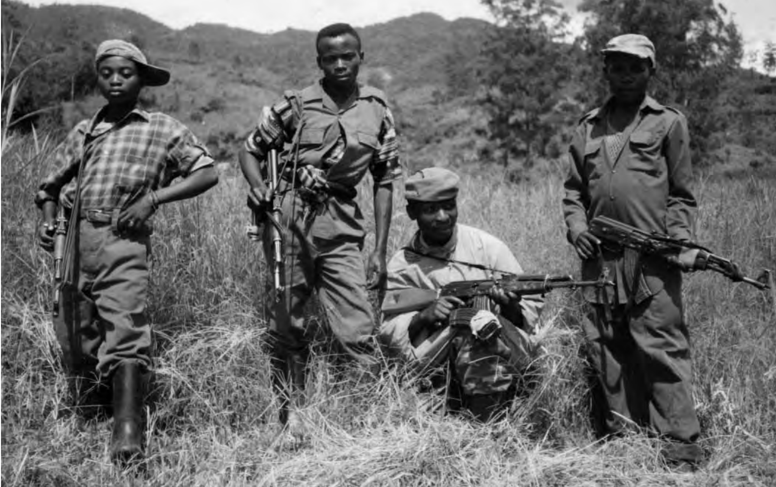
Niños soldado Mayi Mayi, en Kivu Norte, República Democrática de Congo, 2002.