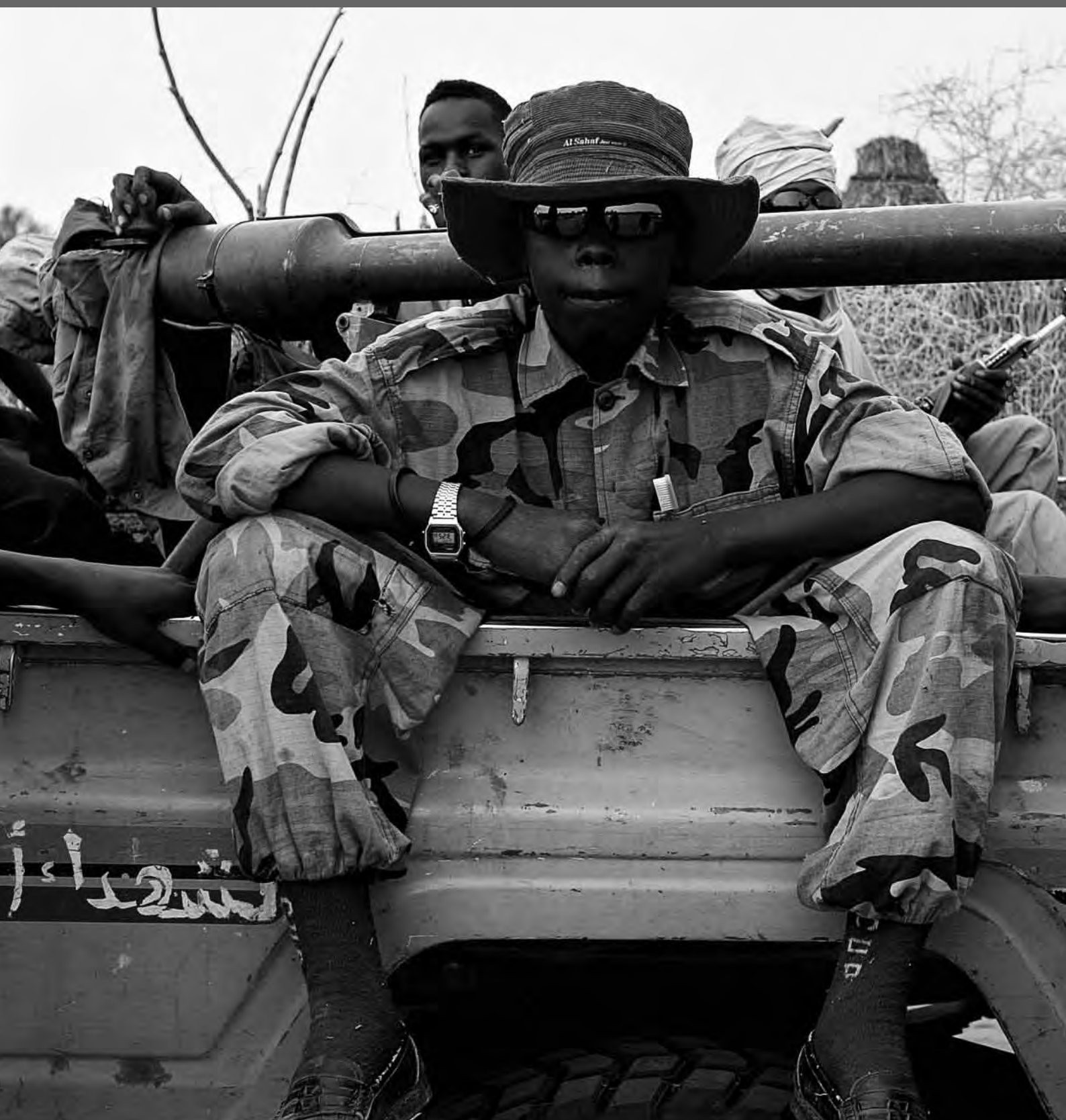
Jóvenes soldados sudaneses en el grupo armado Ejército de Liberación de Sudán, en territorio del grupo, norte de Darfur, Sudán.