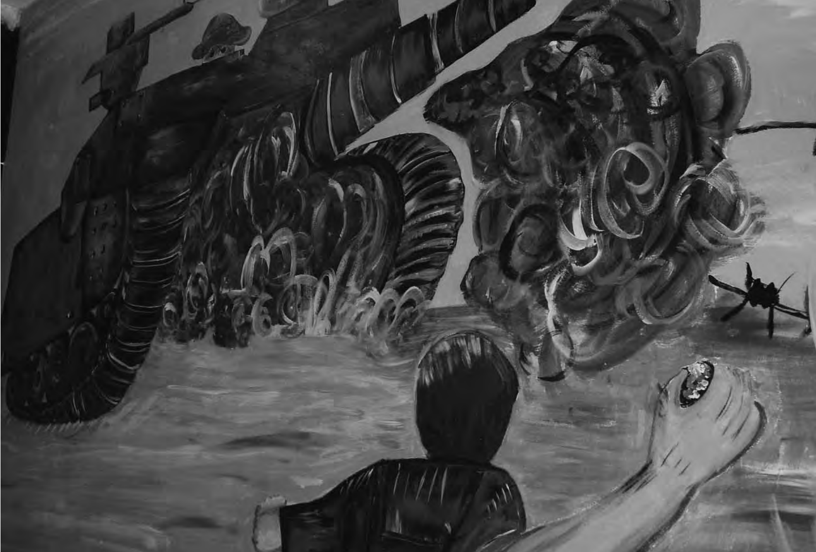
Mural en un centro para jóvenes en el campo de refugiados de Dheisheh, Belén, en el Banco Oeste.

en las normas internacionales sobre justicia de menores, en las que se hace hincapié en los objetivos de rehabilitación y justicia restitutiva, y en las mejores prácticas que se han acumulado en este campo. Además, en los debates también debe incluirse la experiencia de ex niños y niñas soldados, incluidos los que han participado –como víctimas de violaciones de derechos humanos, como responsables de ellas o ambas cosas– en procesos de justicia transicional, ya sean judiciales, no judiciales o tradicionales / consuetudinarios. También deben tenerse en cuenta las opiniones de las víctimas y de los miembros de las comunidades a las que han regresado o van a regresar los niños y las niñas soldados.