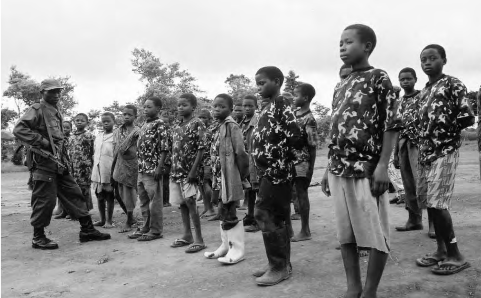
Niños soldado Mayi Mayi recibiendo instrucción en el “Campo de Entrenamiento Político” de Mangangu, Beni, República Democrática del Congo. Julio de 2003.

grupo armado de Costa de Marfil. Ese mismo año, una resolución del Consejo de Seguridad trató de imponer la prohibición de viajar y la congelación de fondos a los dirigentes de la República Democrática del Congo que reclutasen o utilizasen a niños y niñas soldados. 2