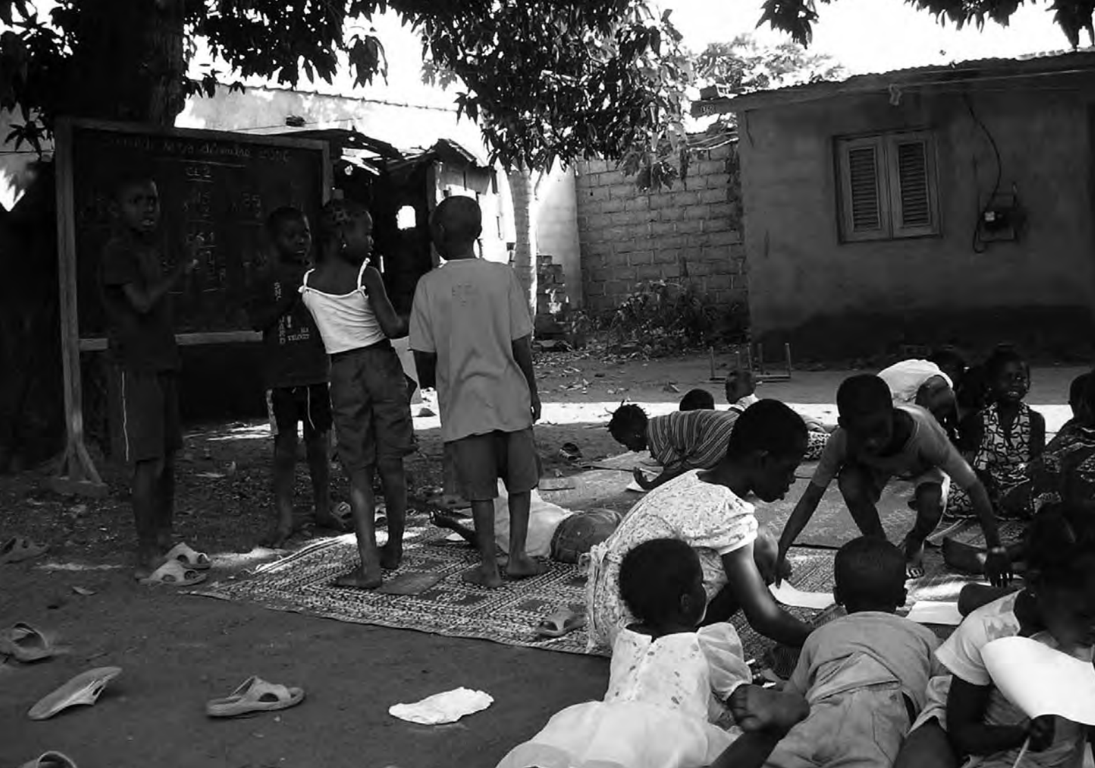
Niños y niñas en un grupo de una comunidad local junto a un campo militar en Bouaké, norte de Costa de Marfil.