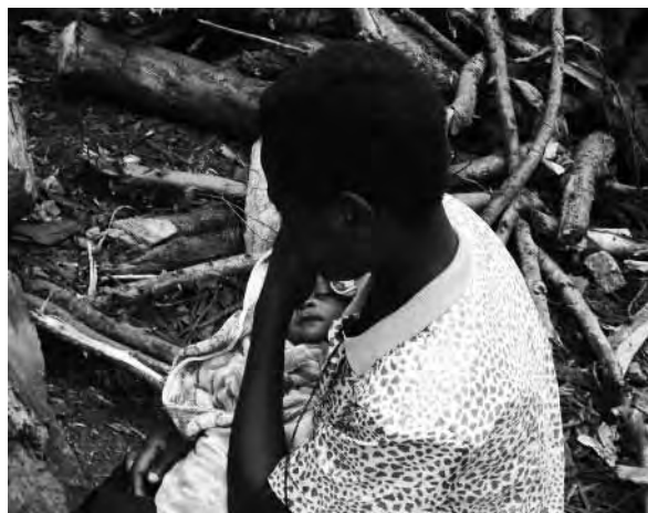
Ex niña soldado con un bebé al que dió a luz mientras estaba en un grupo armado, República Democrática del Congo.

Las razones por las que las niñas no han participado en los procesos oficiales de DDR son complejas. En numerosos conflictos de África, las muchachas han sido retenidas porque realizan útiles funciones de apoyo o se las considera como “esposas”. El Ejército de Resistencia del Señor, por ejemplo, se ha negado a dejar en libertad a unas 2.000 mujeres y a sus hijos alegando que son esposas e hijos de combatientes. Puede que las propias muchachas no deseen que se las identifique como niñas soldados por temor a sufrir el rechazo de sus familias y comunidades, tras considerarse que han “perdido valor” por haber tenido relaciones sexuales. A consecuencia de ello, muchas han regresado a sus comunidades de modo extraoficial, sin que se hayan cubierto sus necesidades médicas, económicas y psicosociales.