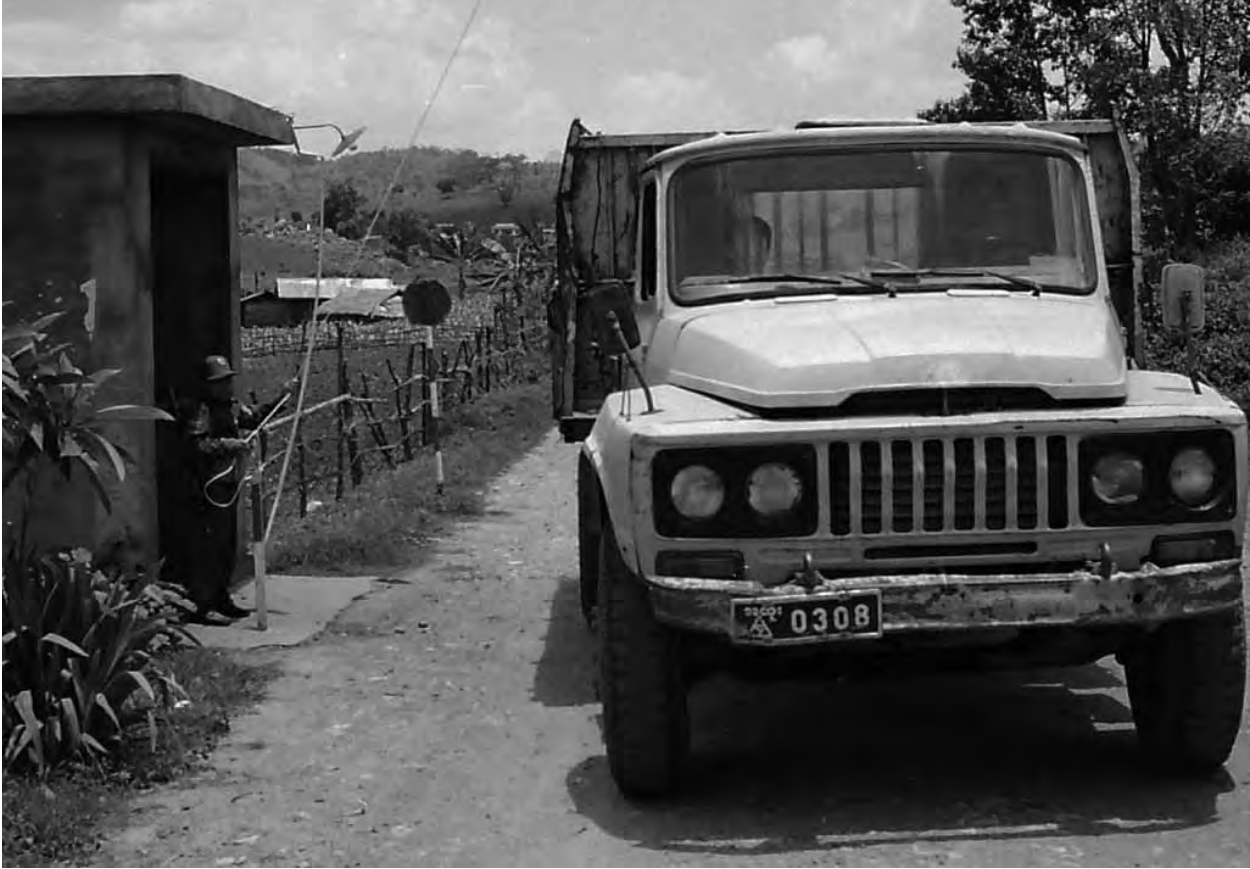
Niño soldado de la etnia Wa en el grupo de alto el fuego, Ejército Unido del Estado de Wa, en un puesto de control de la región de Wa, Estado de Shan, norte de Myanmar.

al 65 por ciento de los aproximadamente 4.000 menores que estudiaron en escuelas militares durante 2005 y 2006 se alistaron en el ejército. En Estados Unidos, se calcula que el 40% de los estudiantes que acaban la enseñanza secundaria y han pasado dos o más años en el Cuerpo de Adiestramiento de Oficiales Juveniles en la Reserva, en el que pueden participar desde los 14 años, acaban alistándose en el ejército. En la Federación Rusa, los menores de entre 12 y 15 años, muchos de ellos huérfanos, que ingresan en escuelas para cadetes no tienen forma legal de revocar su decisión de asistir a ellas o su compromiso de trabajar en el ejército una vez hayan finalizado los estudios.