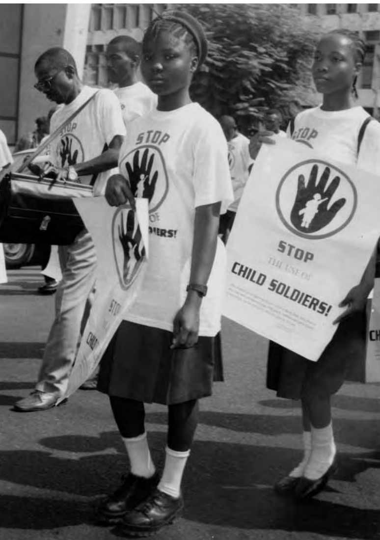
Varios cientos de escolares se manifiestan contra el uso de menores soldado. Freetown, Sierra Leona, 22 de marzo de 2000. El objetivo de la manifestación era el lanzamiento de la campaña de Cáritas-Makeni contra el uso de niños y niñas soldado.

Oí a mis amigas hablar del desarme. Yo no podía desarmarme porque no tenía munición. Tengo amigas que pudieron desarmarse.