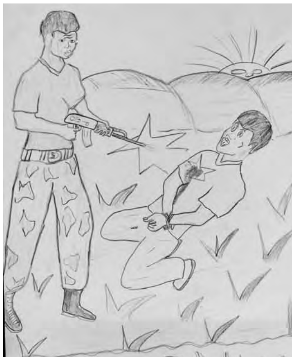
Dibujo de un ex niño soldado del grupo armado Fuerzas de Liberación Nacional, Burundi

Rellenaron los formularios y me preguntaron mi edad, y cuando dije "16" me abofeteó y me dijo: "Tienes 18. Responde 18". Me preguntó otra vez, y yo dije: "Pero esa es mi edad auténtica". El sargento preguntó: "¿Entonces, por qué te alistaste en el ejército?", y yo le respondí: "Contra mi voluntad. Me capturaron". Él dijo. "Bien, entonces mantén la boca cerrada", y rellenó el formulario. Yo sólo quería volver a casa, y se lo dije, pero ellos se negaron. Les dije: "Entonces, déjenme hacer solamente una llamada", pero se negaron también.