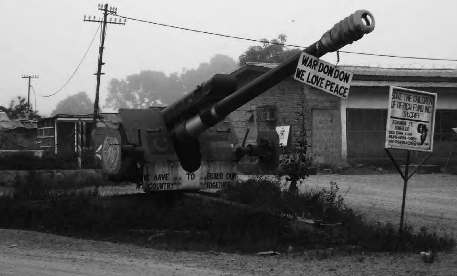
Monumento a la paz en Kono, antigua fortaleza del grupo armado Frente Unido Revolucionario, Sierra Leona.

se entiendan mejor sus experiencias y se comprenda cómo ayudarles a que se recuperen y cómo proteger a los menores en el futuro.