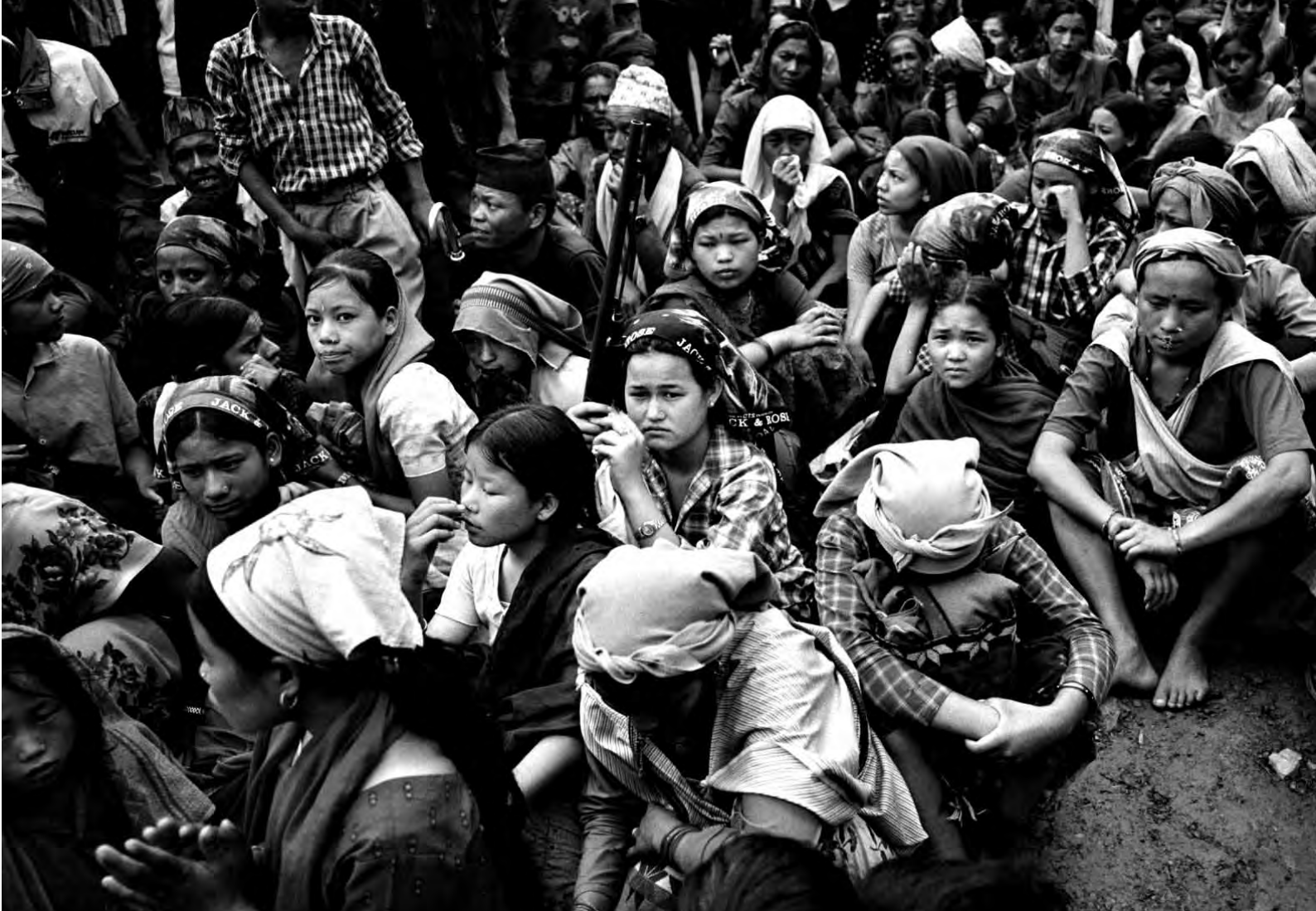
Niñas soldado junto a otras personas reunidas en un acto del Partido Comunista de Nepal (maoista) en Tila, distrito de Rolpa, Nepal.