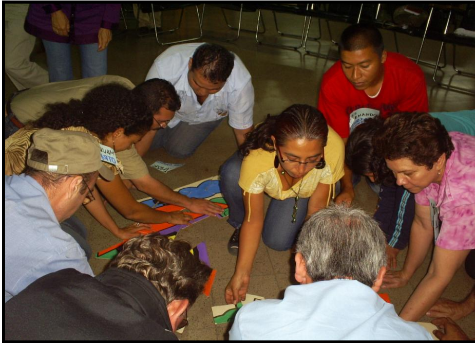
Actividades para el fortalecimiento organizativo de La Redecom. Biblioteca Pública Piloto. Febrero 2007.

Como se había explicado en el capítulo anterior, el interés de la Secretaría de Desarrollo Social de la Alcaldía 57 y DanSocial de fortalecer La Redecom a través de una estrategia de Empresarismo Social y solidario, queda plasmada en un convenio firmado en octubre de 2007, en el cual participa como ente ejecutor la Federación Antioqueña de ONG - FAONG – El fortalecimiento a los medios alternativos de Medellín se constituye en una experiencia que puede ser replicada en otros contextos a nivel nacional, de ahí su intensión de apoyarles en todo lo relacionado con el marco jurídico que los reglamenta.