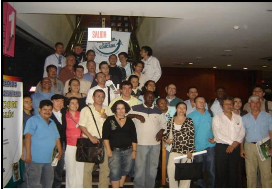
Jornada de constitución de La Redecom – 11 de Octubre 2007. Biblioteca temática de Empresas públicas.