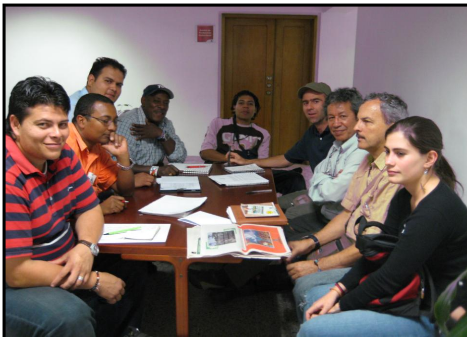
Junta Directiva La Redecom. Alcaldía de Medellín. Diciembre 2007