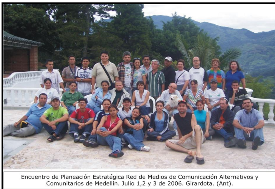
Encuentro de Planeación Estratégica Red de Medios de Comunicación Alternativos y Comunitarios de Medellín. Julio 1,2 y 3 de 2006. Girardota. (Ant).

Uno de los propósitos del Concurso de Méritos consistió en apoyar financieramente la propuesta de asociatividad, con fin de no interrumpir el trabajo desarrollado por los medios alternativos. De esta manera el premio ha permitido continuar con la construcción de la red, a través de la consolidación inicialmente de un nodo central, al que se le denomina - La Redecom - conformado por ocho representantes, dos de cada una de las áreas, los cuales se dedicarían a la articulación del trabajo de los medios de comunicación alternativos en la ciudad 41 .