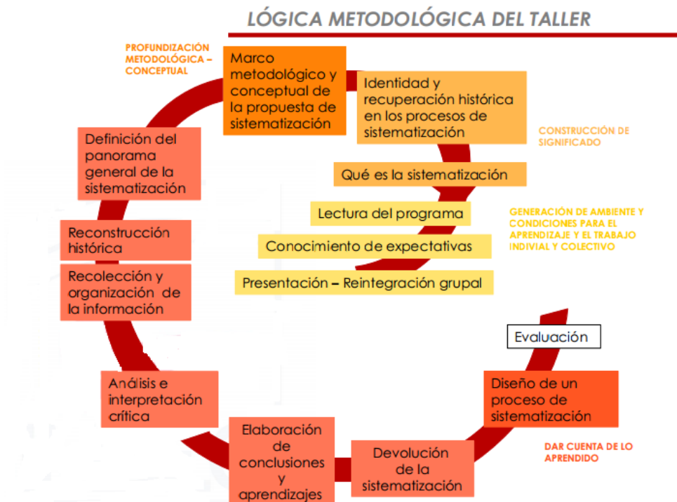
Grafico 1. Lógica Metodológica de los Talleres con los Consejos Comunales trabajada desde 2008 al 2012 en Caracas

Desde el punto de vista de la relación con el Estado , estaríamos hablando de unos “nuevos actores” que se involucran de manera diferente y que participan más activamente en la política y cultura. Ejemplo de ello son las luchas radicalmente populares: indígenas, mujeres, derechos humanos, jóvenes, ecologistas, creyentes religiosos y recientemente los Consejos Comunales en Venezuela.